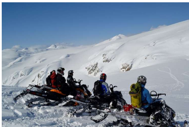
Skutertur i flott skredterreng

Ta et skredkurs! Det er den beste måten å lære mer om snøskred, skredterreng, skredfarevurdering og kameratredning (bruk av skredsøker og hvordan søke i snøskred).