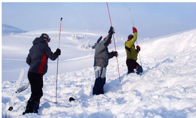
Grovsøk med søkestang