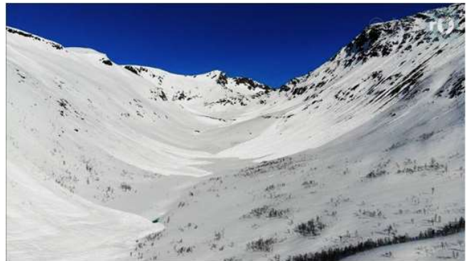
Her har skredene gått så langt at det er farlig å oppholde seg selv midt i dalen hvor det er nesten flatt.

ganger så langt ut som høyden på hengt som løsner.