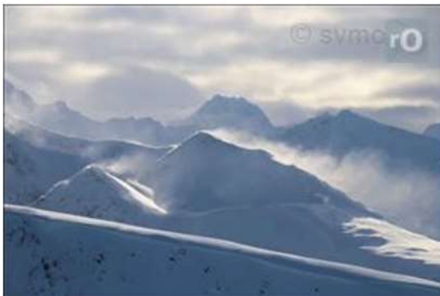
Snøfokk er et tydelig tegn på at skredfaren øker raskt.