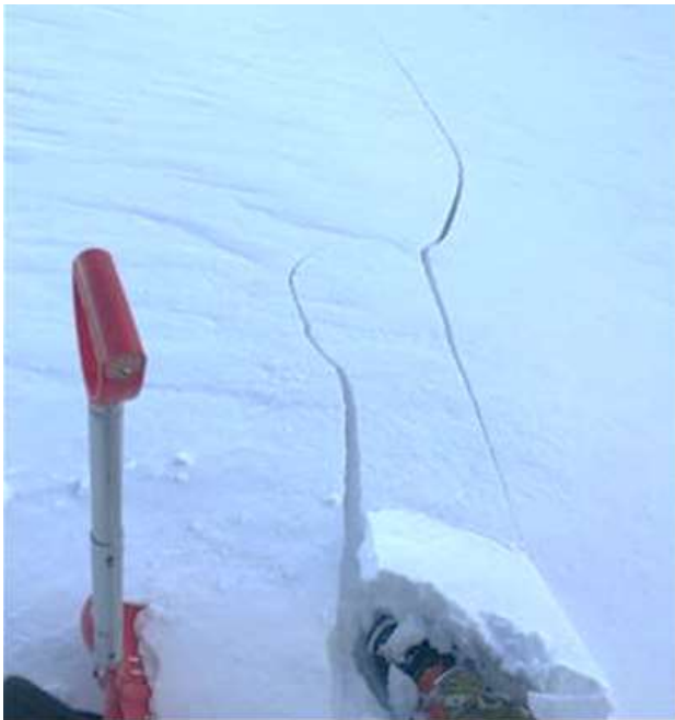
Sprekker i snødekket er dårlige nyheter. Er det bratt nok vil det løse skred under slike forhold

NB! Dersom du ikke oppdager slike tegn kan det likevel være mulig å løse ut skred.